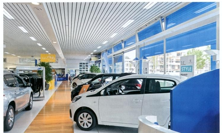
Der Einsatz von LED-Tubes in einer Autoeinstellhalle bzw. in einer Autoausstellung ermöglicht erhebliche Energieeinsparungen.